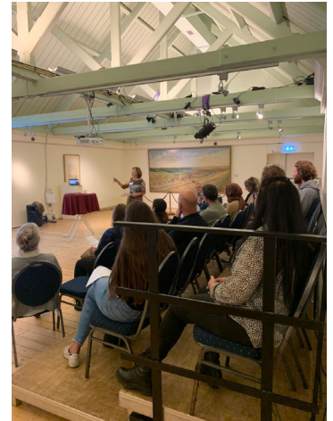
Achterbanavond GMR 10 oktober 2022 in Muzee

In dit kader stond de GMR in het overleg met het College van Bestuur ook stil bij de bovenmatige financiële reserves op scholen. De scholen kunnen deze gelden reserveren bijv. voor het NPO-programma of verduurzaming van het schoolgebouw. Van eventuele resterende reserves wordt een gedeelte bovenschools ingezet. Zo kunnen er investeringen gedaan worden op bovenschools niveau in projecten die de onderwijskwaliteit in brede zin verbeteren, zoals extra investeringen in zij-instroomtrajecten. 'Het is immers niet de bedoeling dat onderwijsgeld op de plank blijft liggen', gaf het CvB aan. Dat beaamde de GMR.