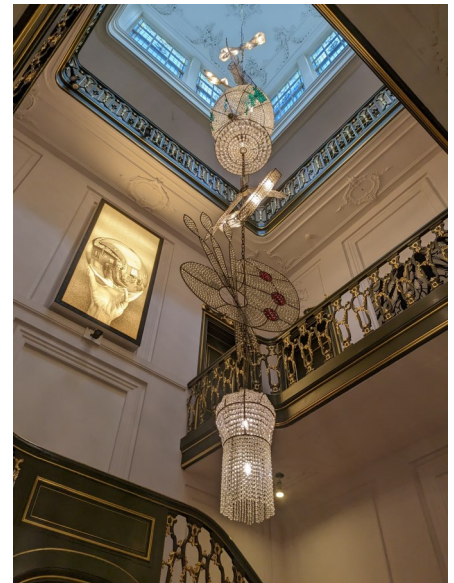
Voor de Eendaagse bijeenkomst in maart bezocht de GMR voor een 'ander perspectief' het museum Escher in Het Paleis.

Natuurlijk kun je vraagtekens plaatsen bij de wenselijkheid van een meerurenbonus, om een voorbeeld te noemen. Het gaat echter om een landelijk initiatief en meedoen zorgt ervoor dat DHS ervaringen kan inbrengen bij een eventueel vervolproces. De PGMR heeft mee nagedacht over welke opties bij De Haagse Scholen passend zijn en hoe deze zo goed mogelijk vorm kunnen krijgen. Het blijft een pilot en de PGMR is benieuwd naar de evaluatie van de opties in de praktijk.